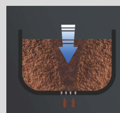
可變時預浸泡功能