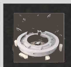
專業級陶瓷研磨器